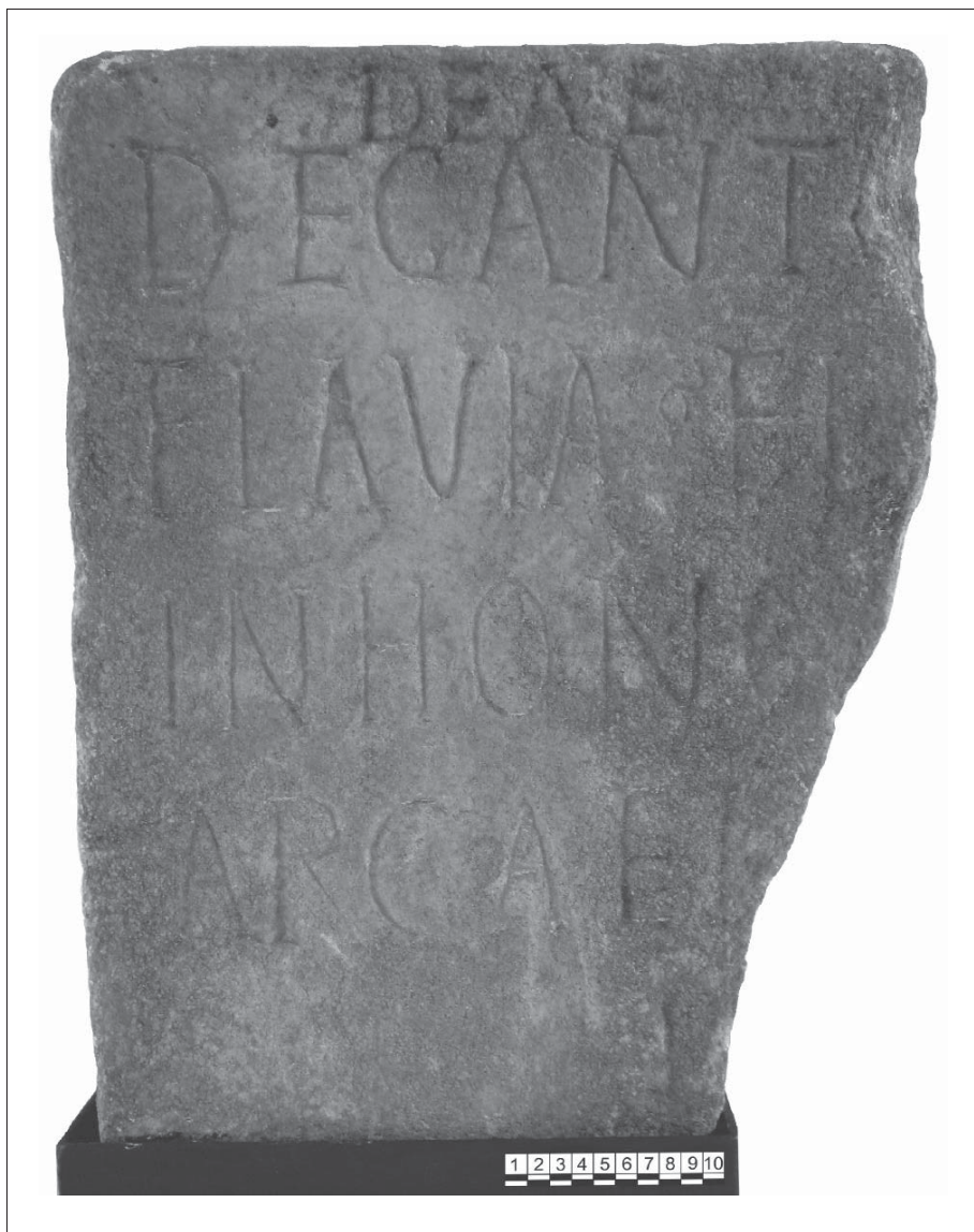
Fig. 1, inscripción de Cacabelos, León (CIL II 5672).