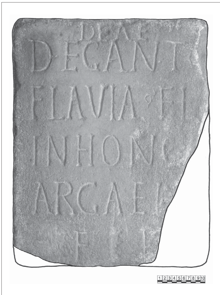
Fig. 3, inscripción de Cacabelos, León ( CIL II 5672), con restitución del tamaño original del soporte.